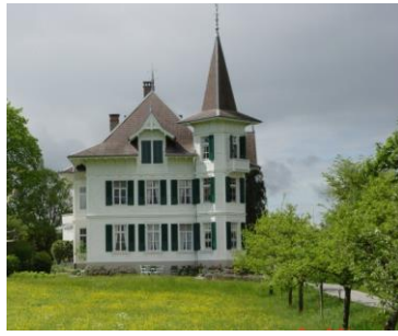
Le Rüdli, Einigen